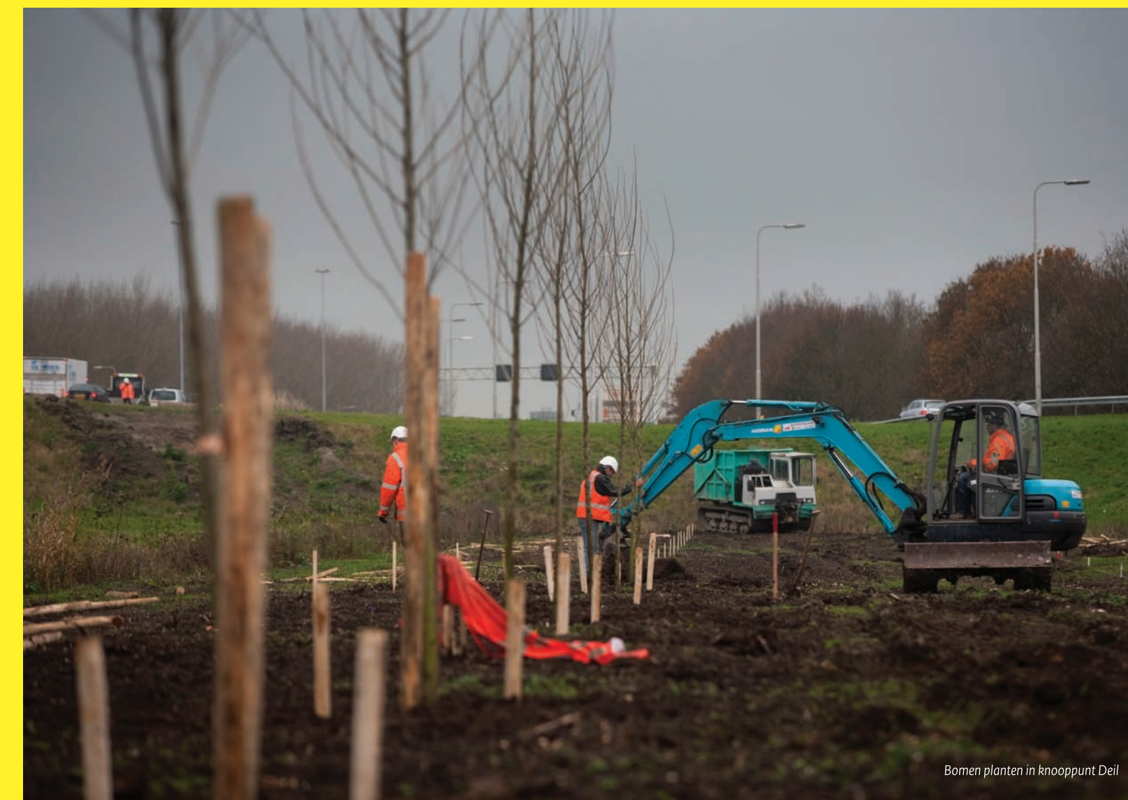
Bomen planten in knooppunt Deil